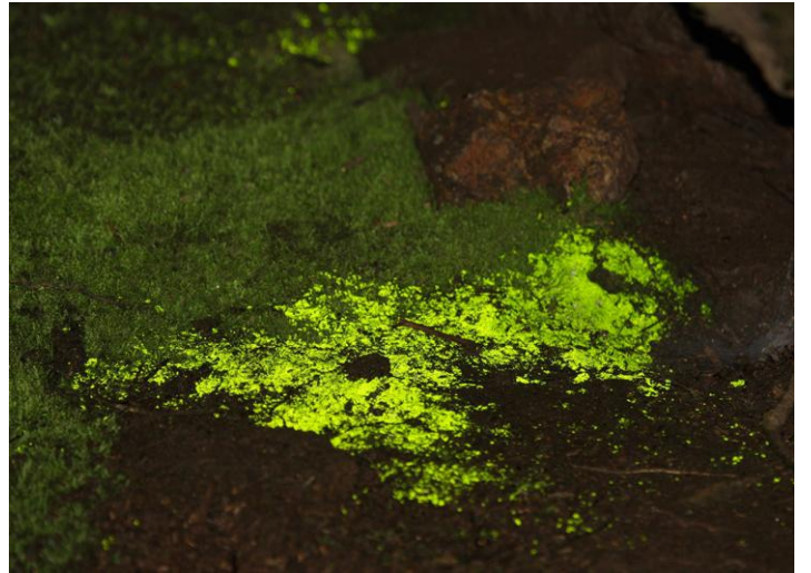
Brión luminiscente ( Schistostega pennata )