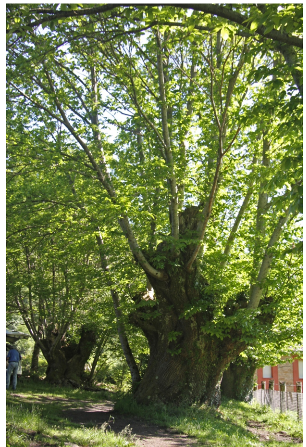
Souto de Biduedo